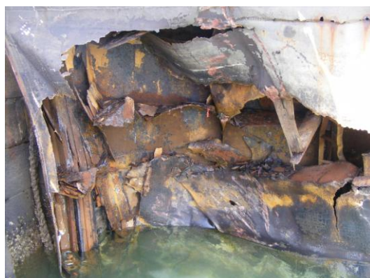
Bateau porte n°1 : photos après accident.

Une réunion d'urgence s'est aussitôt tenue avec le représentant de l'armement du navire pour trouver un consensus sur les moyens à mettre en œuvre pour la réparation rapide du dégât. Suite : page 2.