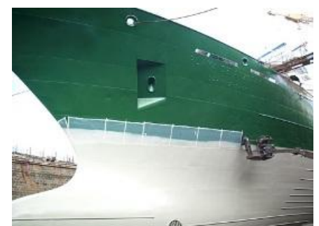
Photos : application peinture silicone après sablage.