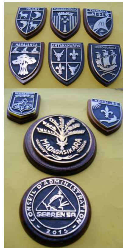
Ecussons : échantillons des réalisations de l'atelier Fonderie de la SECREN SA.

A la SECREN SA, l'atelier Fonderie s'occupe en plus des fabrications des pièces brutes, des écussons et divers articles de cadeaux, des travaux de galvanisation à chaud par immersion des tuyaux et plaques de métal.