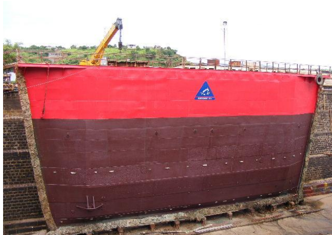
Bateau porte n°1 après réparation.

Le bateau porte n°1 est bel et bien de nouveau opérationnel. Il est presque remis à neuf et prêt pour la campagne thonière 2016.