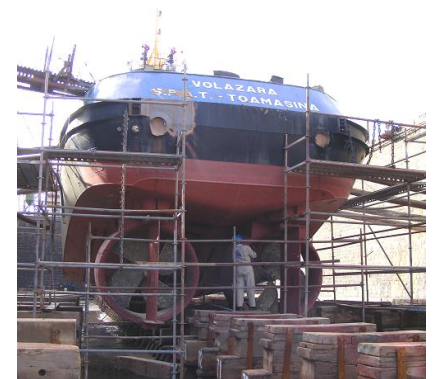
Le remorqueur VOLAZARA en cale sèche.

Le planning des bateaux en carénage est tributaire des saisons. Pour ne citer que cet exemple : le carénage du remorqueur VOLAZARA de SPAT Tamatave a eu un glissement à cause du temps pluvieux lors de son passage au bassin de Radoub. L'impact de ce glissement est que l'entrée au bassin des bateaux qui devaient succéder VOLAZARA pour le traitement de la carène est repoussée à des dates ultérieures.