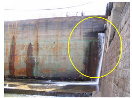
Répercussion du choc du côté intérieur.

Cette épreuve a montré encore une fois la compétence et le savoir faire de la SECREN SA pour faire flotter le bateau porte avant de procéder à sa réparation. A noter que ce bateau porte pèse 600 tonnes.