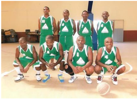
Equipe vétérans de COSMOS SECREN.